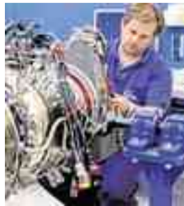
MTU-Mitarbeiter bei der Montage eines Triebwerks.

MÜNCHEN Der Aufschwung im Flugverkehr hat dem Triebwerkshersteller MTU Aero Engines volle Auftragsbücher und mehr Umsatz beschert. Der Gewinn stagniert aber wegen steigender Forschungs- und Entwicklungskosten. Heuer entfällt der Löwenanteil der Entwicklungskosten auf das Turbofan-Triebwerk für den geplanten Airbus A320neo, für dessen Produktion auch das Werk in München erweitert werden soll. Bei EADS, für dessen Anteile die Bundesregierung Investoren sucht, will MTU übrigens nicht einsteigen.