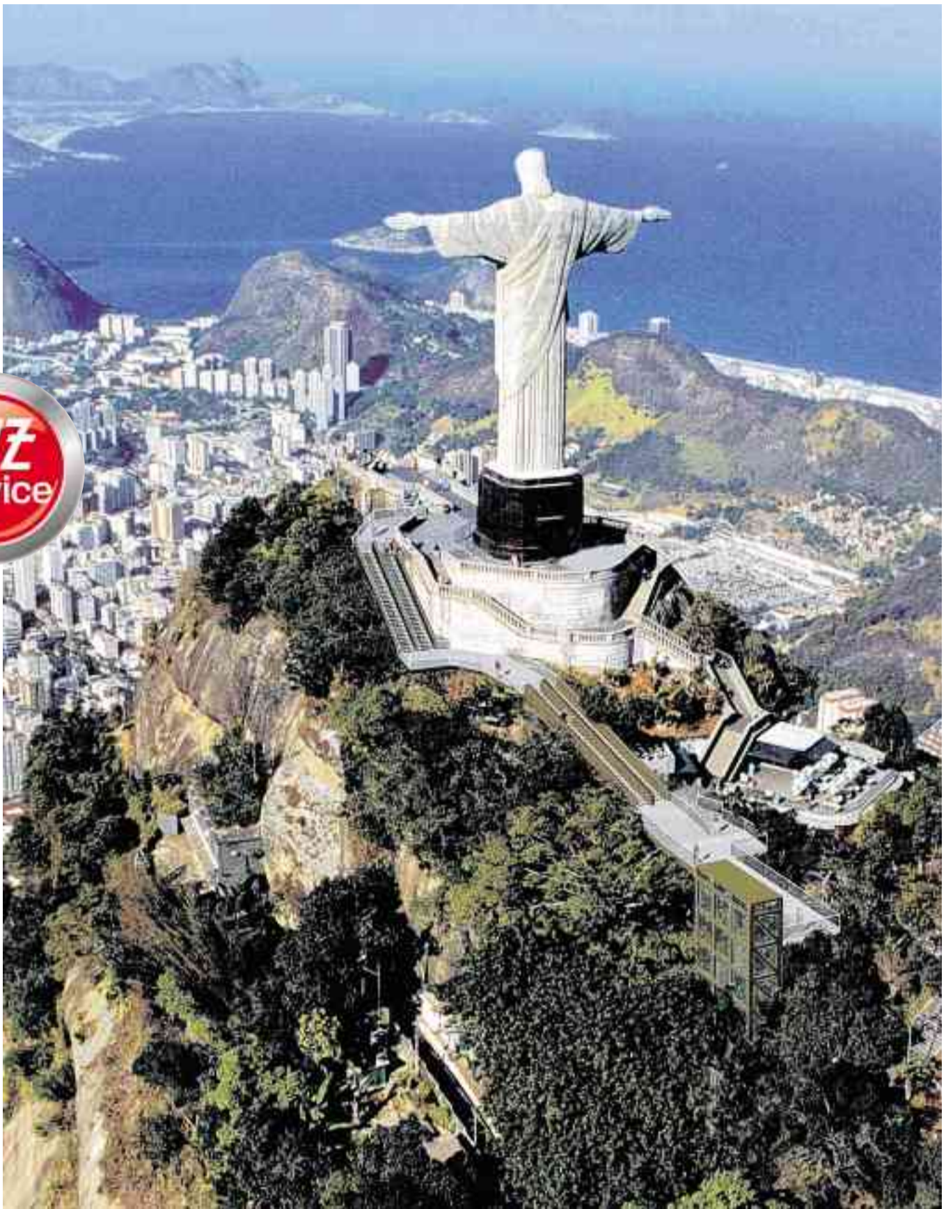
Christusstatue über Rio de Janeiro: Wer gute Nerven hat, legt sich Aktien des emporstrebenden Landes zu.

Aktien für die längerfristige Anlage. Wer sein Geld für fünf Jahre oder länger anlegen will,