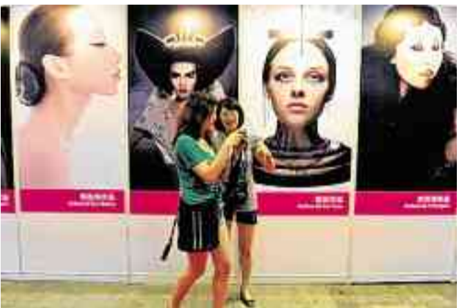
Auch beim Konsumieren fleißig: Chinesinnen vor der Reklamewand einer Schönheitsmesse.