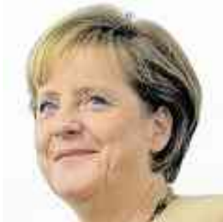
Muss ähnlich wie China hohe Exporte rechtfertigen: Merkel.

Der russischen Führung hatte Merkel eine Partnerschaft zur Modernisierung des Landes angeboten – in China ist die deutsche Wirtschaft längst präsent. Im Kanz-